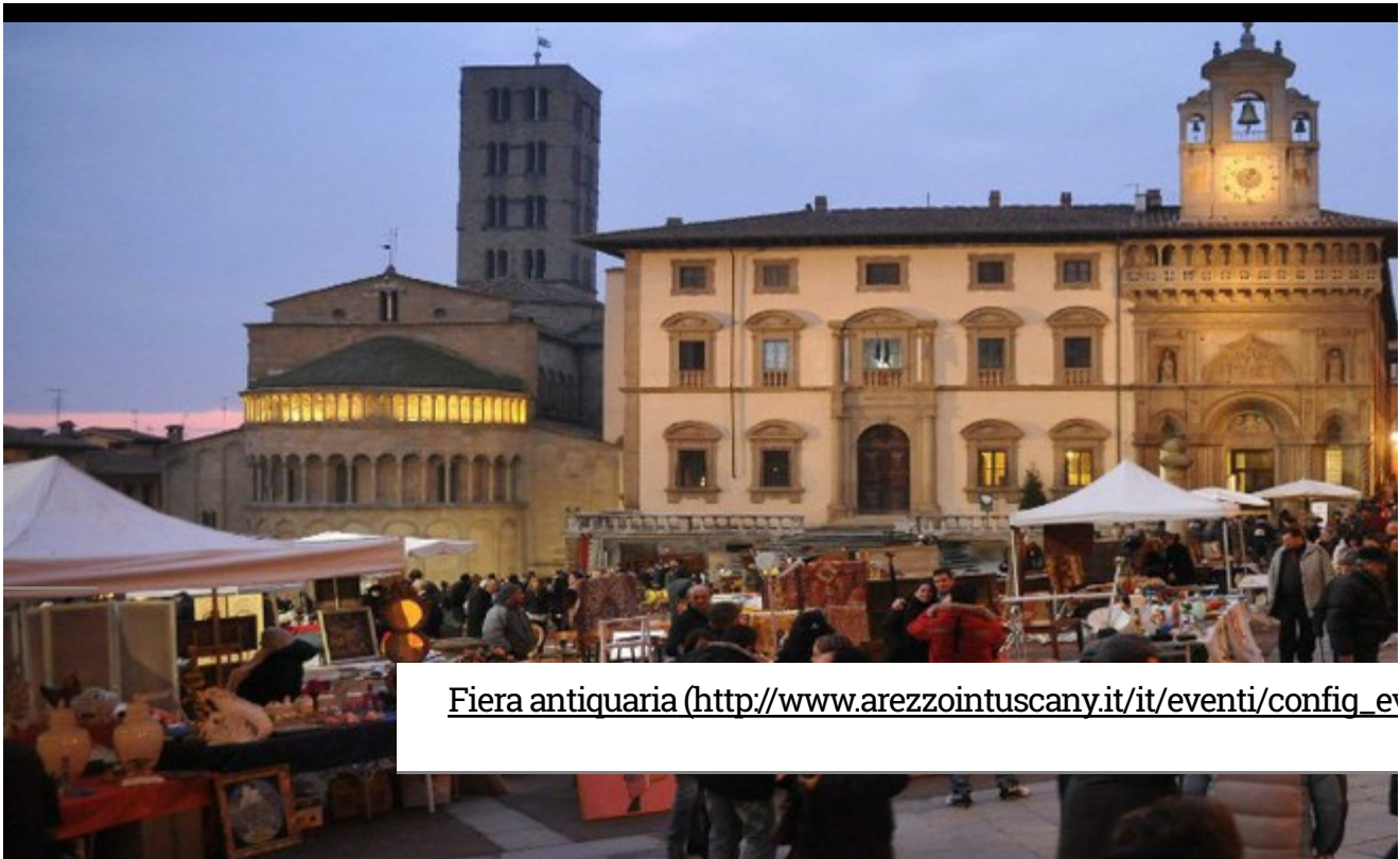
Fiera antiquaria ( http://www.arezointuscany.it/it/eventi/config_e )