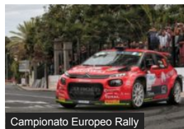
ERC: Rally Islas Canarias...