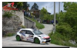
De Tommaso domina il Rall...