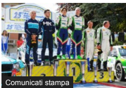
IRC: Rally del Taro, nuov...