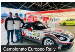
Abarth Rally Cup: Monarri...