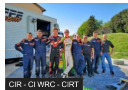
Consani vince il Rally Ad...