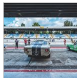
( https://www.versiliatoday.it/2019/05/01/cento-ore-2019-si-accendono-motori/ok-photoclassicracing-0636/ )