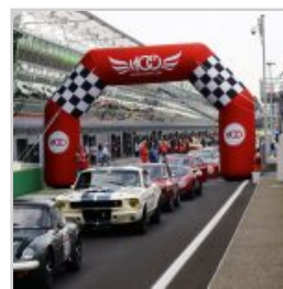
( https://www.versiliatoday.it/2019/05/01/cento-ore-2019-si-accendono-motori/ok-modena-100-ore-monza-eni-circuit-2018-4/ )