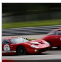
( https://www.versiliatoday.it/2019/05/10/modena-versiliatoday.it/2019/05/01/cento-ore-2019-si-accendono-motori/ok-modena-100-ore-monza-eni-circuit-2018-53/ )