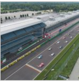
(https://www.versiliatoday.it/2019/05/05/sno/dema-5106/) cento-ore-2019-si-accendono- motori/ok-dji_0022/)