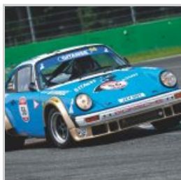
( https://www.versiliatoday.it/2019/05/10/modena-versiliatoday.it/2019/05/01/cento-ore-2019-si-accendono-motori/ok-photoclassicracing-1170/ )