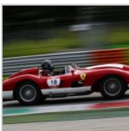
( https://www.versiliatoday.it/2019/05/10/modena-versiliatoday.it/2019/05/01/cento-ore-2019-si-accendono-motori/ok-modena-100-ore-monza-eni-circuit-2018-56/ )