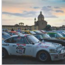
(https://www.versiliatoday.it/2019/05/05/sno/dema-5106/) cento-ore-2019-si-accendono- motori/ok-dsc_9608/)