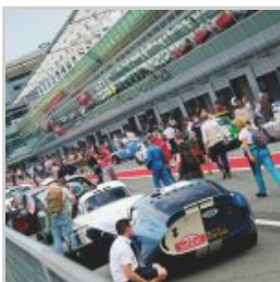
( https://www.versiliatoday.it/2019/05/10/modena-versiliatoday.it/2019/05/01/cento-ore-2019-si-accendono-motori/ok-photoclassicracing-1985-2/ )