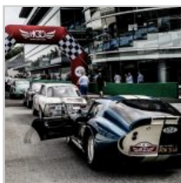
( https://www.versiliatoday.it/2019/05/10/modena-versiliatoday.it/2019/05/01/cento-ore-2019-si-accendono-motori/ok-img_8627/ )