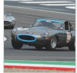
(https://www.versiliatoday.it/2019/05/05/sno/dema-5106/) cento-ore-2019-si-accendono- motori/ok-foto_0127/)