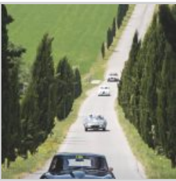
(https://www.versiliatoday.it/2019/05/05/sno/dema-5106/) cento-ore-2019-si-accendono- motori/ok-fra_2008/)