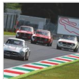
( https://www.versiliatoday.it/2019/05/01/cento-ore-2019-si-accendono-motori/ok-photoclassicracing-2356-2/ )