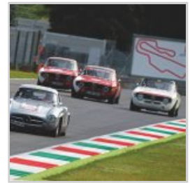
(https://www.versiliatoday.it/2019/05/05/sno/dema-5106/) cento-ore-2019-si-accendono- motori/ok-photoclassicracing-2356/)