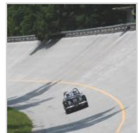
(https://www.versiliatoday.it/2019/05/05/sno/dema-5106/) cento-ore-2019-si-accendono- motori/fra_9637-2/)