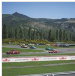
(https://www.versiliatoday.it/2019/05/05/sno/dema-5106/) cento-ore-2019-si-accendono- motori/ok_dsc_5165/)