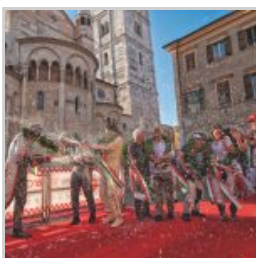
( https://www.versiliatoday.it/2019/05/10/modena-versiliatoday.it/2019/05/01/cento-ore-2019-si-accendono-motori/ok-photoclassicracing-4105/ )