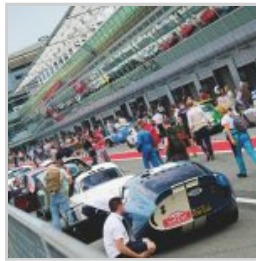
(https://www.versiliatoday.it/2019/05/05/sno/dema-5106/) cento-ore-2019-si-accendono- motori/ok-photoclassicracing-1985/)