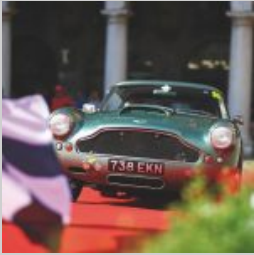
(https://www.versiliatoday.it/2019/05/05/sno/dema-5106/) cento-ore-2019-si-accendono- motori/ok-dsc_2305/)