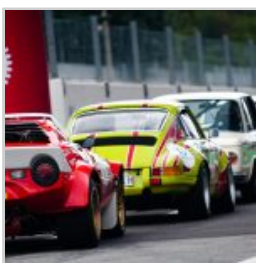
( https://www.versiliatoday.it/2019/05/10/modena-versiliatoday.it/2019/05/01/cento-ore-2019-si-accendono-motori/ok-mco_018_514carbone/ )