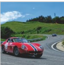
(https://www.versiliatoday.it/2019/05/05/sno/dema-5106/) cento-ore-2019-si-accendono- motori/ok-photoclassicracing-3249/)