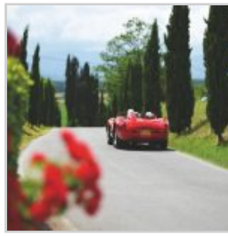
(https://www.versiliatoday.it/2019/05/05/sno/dema-5106/) cento-ore-2019-si-accendono- motori/ok-dsc_1604/)