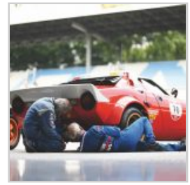
(https://www.versiliatoday.it/2019/05/05/sno/dema-5106/) cento-ore-2019-si-accendono- motori/ok-dsc_1614/)