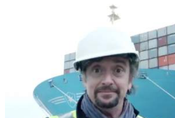
Richard Hammond torna su Discovery c BIG!

A loro la possibilità di vivere lo splendore del Belpaese, in una trama fatta di confronti sportivi, cultura, turismo, buona cucina ed ospitalità. Il merito di tanta bellezza va al team di Canossa Events e alla Scuderia Tricolore, che hanno curato al meglio ogni dettaglio, per consegnare un'esperienza indimenticabile ai protagonisti.