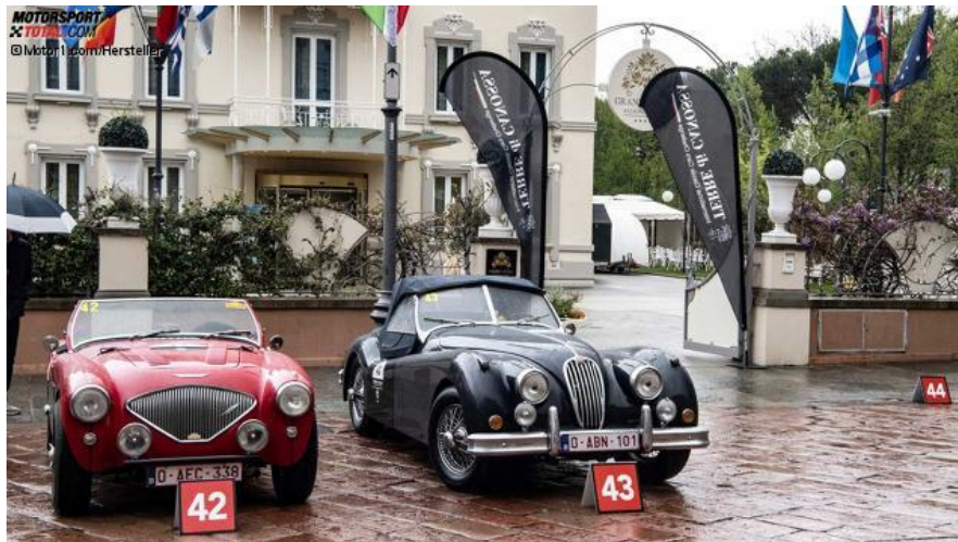
Raduno Terre di Canossa